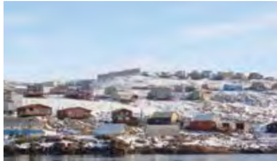
ልውጥ ለማድረግ ምን ዓይነት ስራዎች አሉ?

ልውጥ ለማድረግ ምን ዓይነት ስራዎች አሉ? ልውጥ ለማድረግ ምን ዓይነት ስራዎች አሉ? ልውጥ ለማድረግ ምን ዓይነት ስራዎች አሉ? ልውጥ ለማድረግ ምን ዓይነት ስራዎች አሉ?