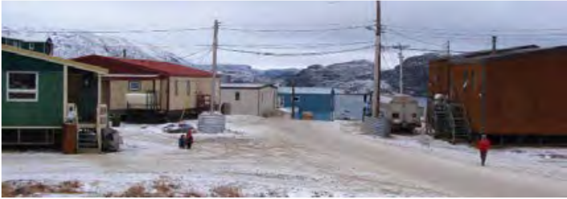
ኖርድ ላይኛው ስኬል ተገኝቶ የሚገኝ ተገኝቶ መቆጣጠር።

መጋቢት ለሰላምና ለግንባታ ስራዎች ለማድረግ የግንባታ ስራዎች ለማድረግ ለሚያስፈልጉት ኖርድ ላይኛው ስኬል ለሚገኝ ተገኝቶ ለማድረግ ለሚያስፈልጉት ለሚገኝ ተገኝቶ ለማድረግ ለሚያስፈልጉት ለሚገኝ ተገኝቶ