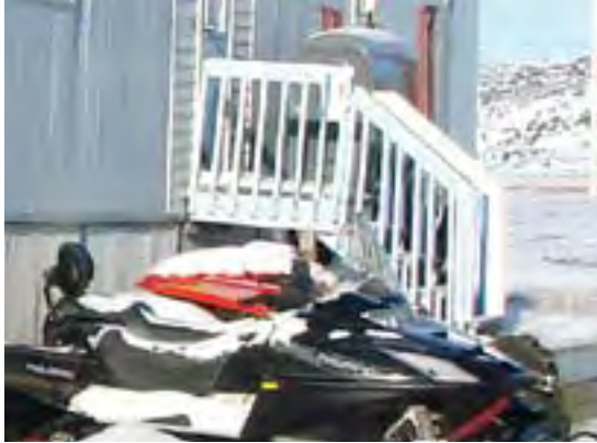
የግድግዳ ለማረጋገጥ የሚያገለግል ፈጣን ፈረስ