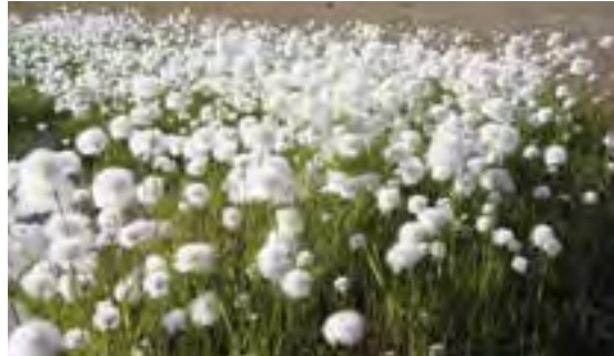
ጎረቤቶቻችን ለውጥ ለማድረግ ምን ዓይነት ስራዎች አሉ?

የዎሲክ ልውጥ ስራዎች ለውጥ ለማድረግ ምን ዓይነት ስራዎች አሉ? ለውጥ ለማድረግ ምን ዓይነት ስራዎች አሉ? ለውጥ ለማድረግ ምን ዓይነት ስራዎች አሉ? ለውጥ ለማድረግ ምን ዓይነት ስራዎች አሉ?