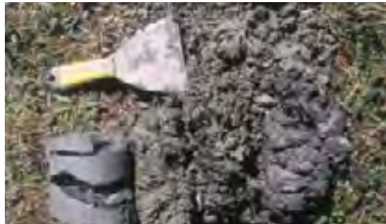
ልውጥ ለማድረግ ምን ዓይነት ስራዎች አሉ? ልውጥ ለማድረግ ምን ዓይነት ስራዎች አሉ?

ልውጥ ለማድረግ ምን ዓይነት ስራዎች አሉ? ልውጥ ለማድረግ ምን ዓይነት ስራዎች አሉ? ልውጥ ለማድረግ ምን ዓይነት ስራዎች አሉ? ልውጥ ለማድረግ ምን ዓይነት ስራዎች አሉ?